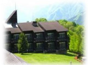
大滝げんきプラザ