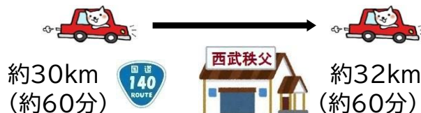
秩父市内(西武秩父駅)