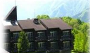
大滝げんきプラザ