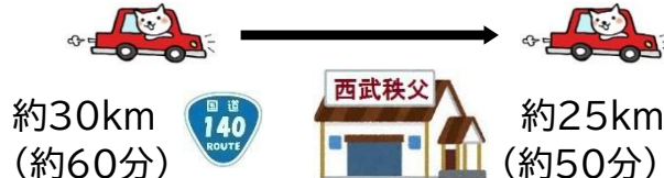
秩父市内(西武秩父駅)