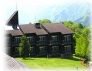
大滝げんきプラザ